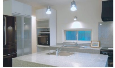
大理石のアイランドキッチンで ホームパーティー三昧