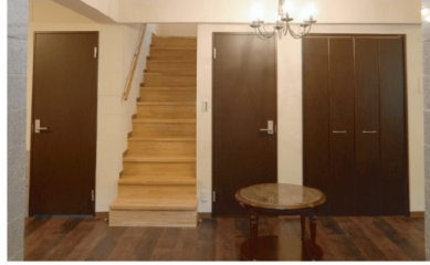
玄関を開放感溢れる ヨーロッパ調の空間に