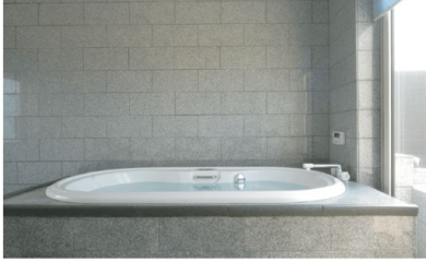
屋上で露天風呂で寛ぐ